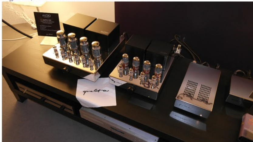
Az Audio-Hungary Qualiton flottája, köztük az új 100 Wattos erősítővel - lenyűgöző látvány.

Olvasóink a következő napokban több részletben kapnak majd beszámolót az eseményekről, és az újdonságokról, most csak egy örömlöknek adunk kiemelt hangsúlyt, ez pedig az Audio Hungary müncheni megjelenése, akik a Halle 1 kiállítási csarnokban várták az érdeklődőket.