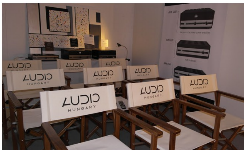
Az Audio Hungary hangulatos bemutató teremmel várja a látogatókat, és a kereskedelmi szakembereket a kiállításon

A nálunk is egyre népszerűbb, és már sorozatgyártás alatt lévő Qualiton High End erősítők mellett a cég felvonultatta a teljes készletet, és örömlöknek adunk kiemelt hangsúlyt, ez pedig az Audio Hungary müncheni megjelenése, akik a Halle 1 kiállítási csarnokban várták az érdeklődőket.