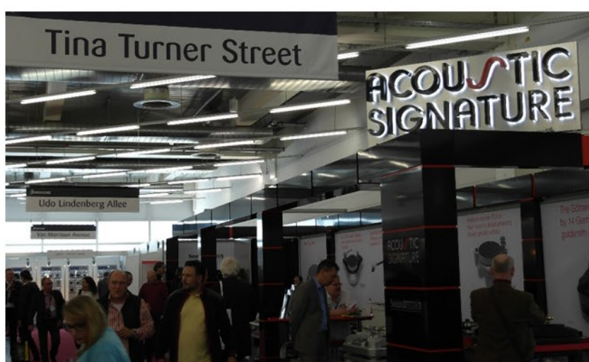
Megadja a kiállítás alaphangját, a nagy zenészekről elnevezett passzázs, ahol a zenei világ ikonjai vannak megörökítve, köztük Liszt Ferenc neve is.

A kiállítás hangulatára jellemző, az általam már sokszor megcsodált, és a csarnokokban látható nagy zenészek nevével viselő passzázs elnevezés, ami a standok között vezető utcák felett látható. A több ezer kiállító - kicsik és nagyok - hihetetlen lendülettel és odaadással foglalkoznak az érdeklődőkkel, az egész jelenség kicsit bábeli képet nyújt, hiszen Európa és Amerika, sőt Oroszország gyártói vannak itt, ki-ki a saját nyelven, és persze az angol nyelv egy nagyon speciális keverékén kommunikálnak egymással.